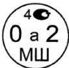
Рисунок 4.1. Знак поверки государственного регионального центра метрологии