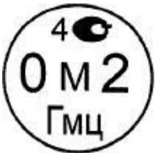
Рисунок 4.2. Знак поверки государственного научного метрологического института